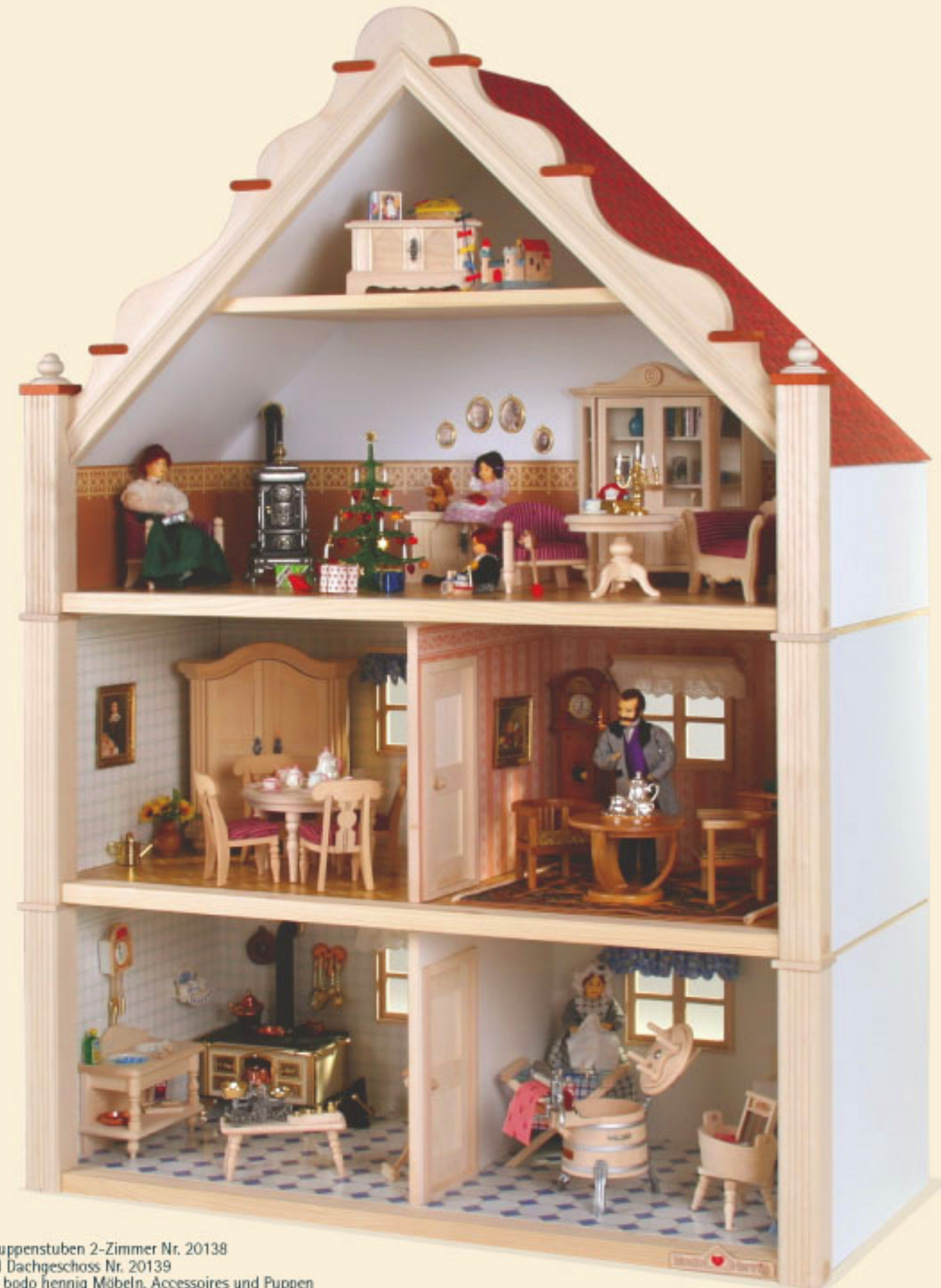
2 Puppenstuben 2-Zimmer Nr. 20138 und Dachgeschoss Nr. 20139 mit bodo hennig Möbeln, Accessoires und Puppen