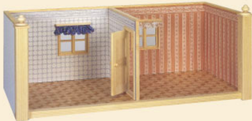
20138 Puppenstube 2-Zimmer Wer bei mehreren Stüben übereinander eine andere Tapete wünscht, kann mit der Tapetenauswahl auf Seite 56 selbst sein persönliches Ambiente zaubern.